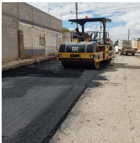
Rehabilitación de pavimentación en la localidad de Pozo de Gamboa, calle Ignacio Zaragoza (4 mil 30 m2 de mezcla asfáltica)