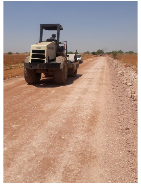
Construcción de terracería en la localidad Llano Blanco Norte, carretera Pozo de Gamboa-Llano Blanco Norte (2 mil 135 m2)