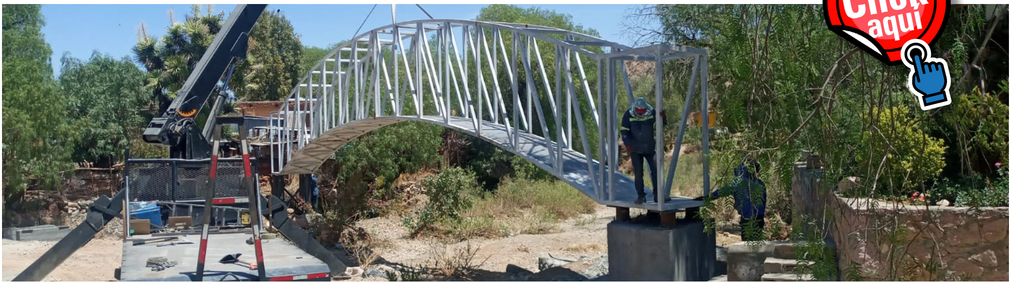
Construcción de Puente Peatonal, en la localidad Casa de Cerros, calle Martín de Zavala- FISMDF (77 mil 20 de m2)