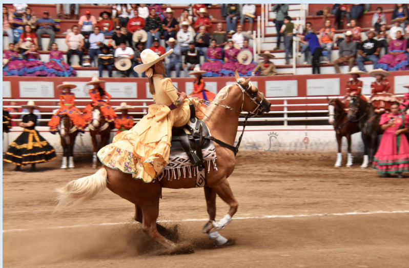
La Nota Zacatecas