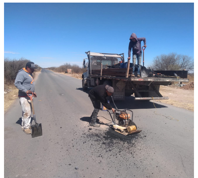
Bacheo superficial camino San Antonio-Los Pozos (252.29m2)