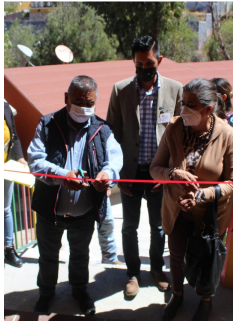
Inauguración del Comedor Estudiantil en el Jardín de Niños Zoraida Pinedo