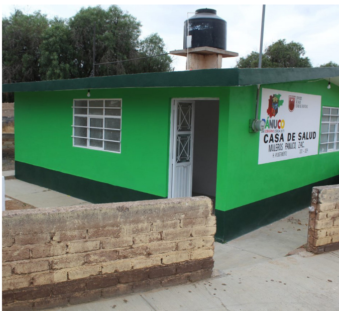
Rehabilitación de la Casa de Salud en la localidad Muleros