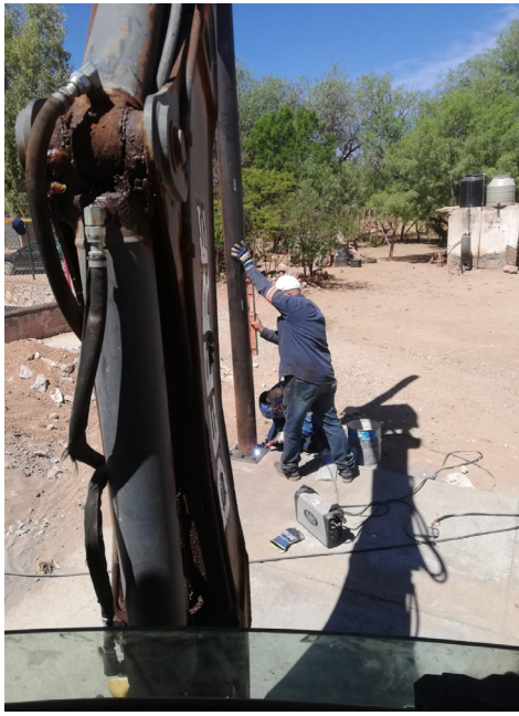
Construcción de techado en la localidad Jesús María (172 mil 94 m2)