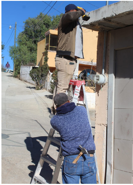
Colocación de nomenclatura en la cabecera