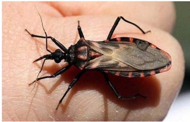
La presencia de alacranes y chinches aumenta con el cambio de temperatura

están más cerca de los humanos y hay posibilidad de que haya encuentros en ocasiones no muy agradables”.