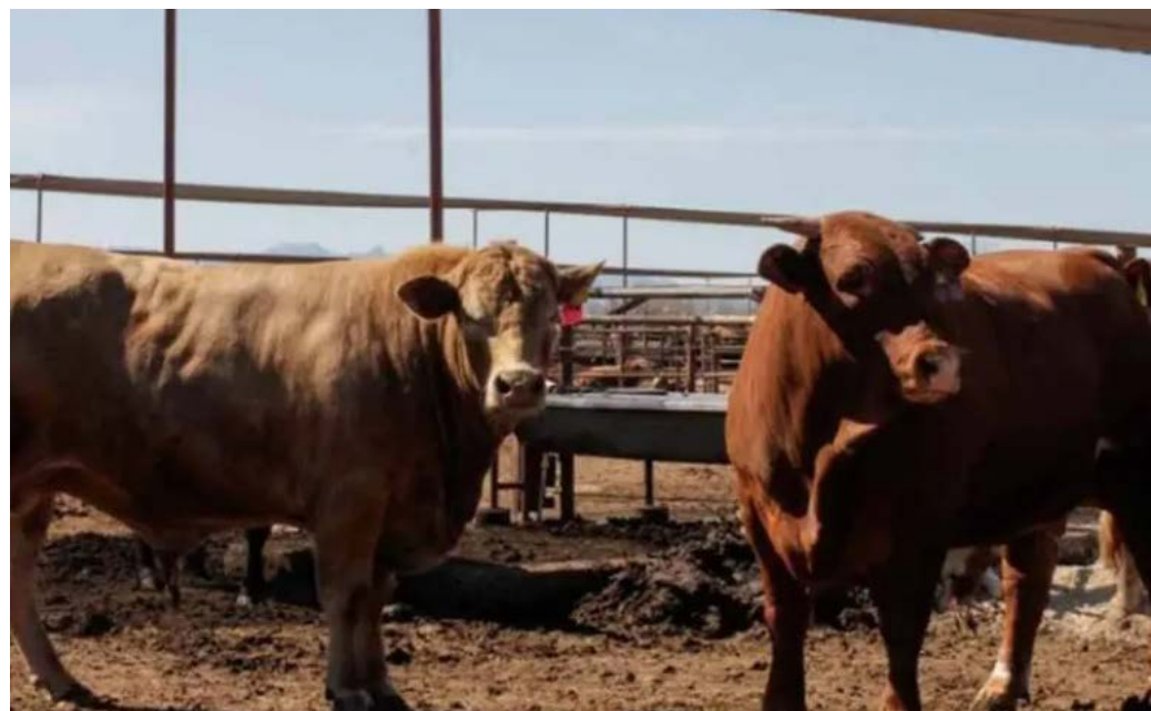
LNZ • FOTOS: CORTESÍA

NUEVO LEÓN.- Ante la presencia del gusano barrenador en el sureste de México, engordadores de Nuevo León diseñaron e impulsan un plan para retrasar su llegada al estado y controlar su impacto en el hato ganadero, reveló la Asociación de Engordadores de Ganado Bovino del Noreste (AEGBN), este martes.