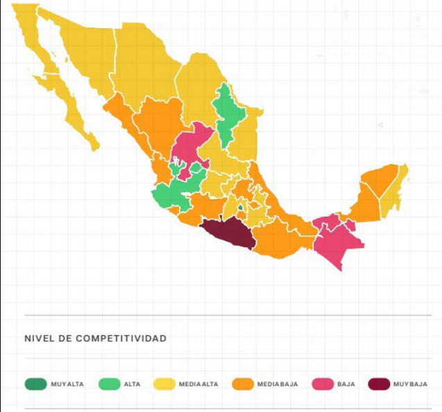
Mapa 1.1 Resultados del subíndice Innovación y Economía por nivel de competitividad