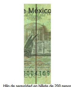
Hilo de seguridad en billete de 200 pesos