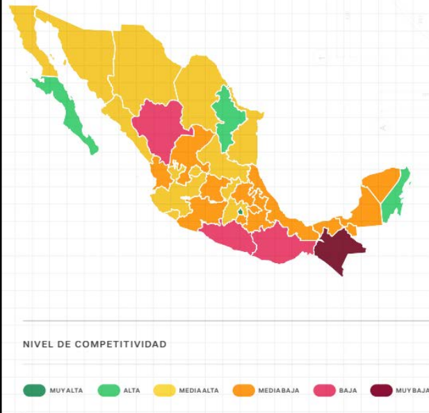
Mapa 2.1 Resultados del subíndice Infraestructura por nivel de competitividad