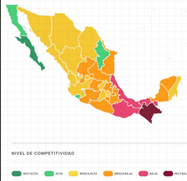
Mapa 3.1 Resultados del subíndice Mercado de trabajo por nivel de competitividad